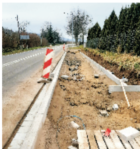
■ Budowa chodnika Przezdrowice