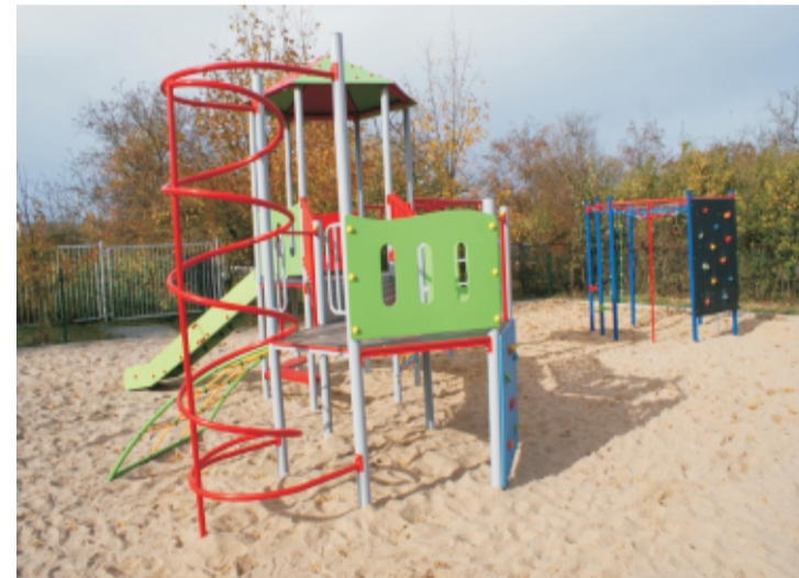
■ Plac zabaw SP nr2 w Sobótce