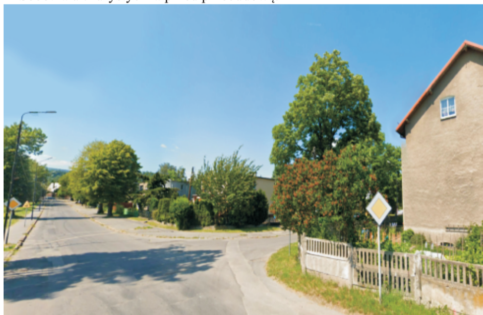
■ Sobótka ul.Dworcowa przed przebudową.