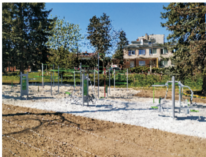
■ Plac zabaw oraz siłownia zewnętrzna w Sobótce

Tworzenie nowych miejsc rekreacyjnych, takich jak skatepark, place zabaw czy budowany tor rowerowy, stanowią miejsca spotkań i aktywnego spędzania czasu wolnego.