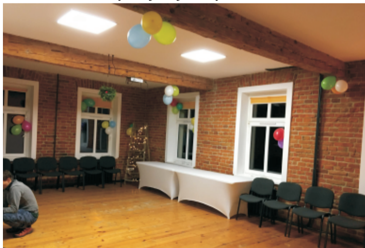
■ Remont świetlicy wiejskiej w Sulistrowicach.