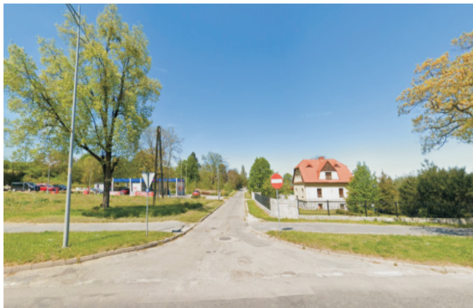
■ Sobótka ul.Turystyczna przed przebudową.