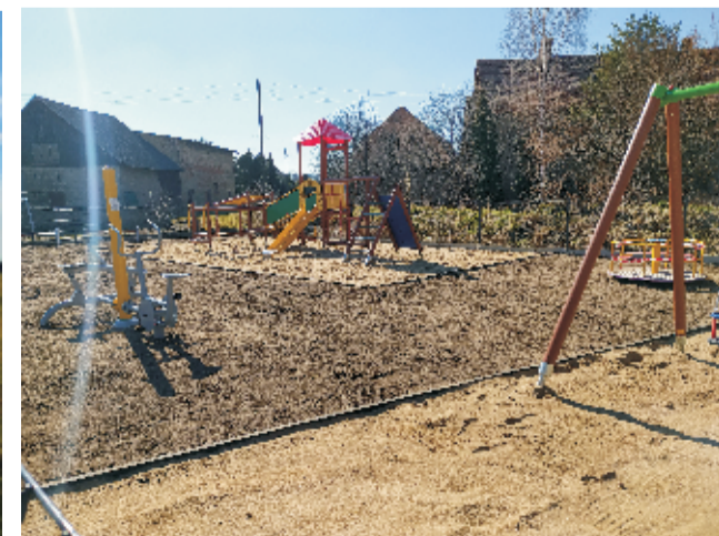
■ Plac zabaw w Strzegomianach