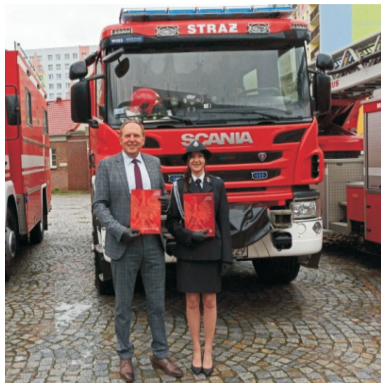
■ Nowy samochód dla OSP Sobótka