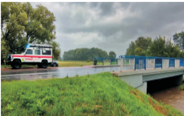
■ Monitoring działań przeciwpowodziowych