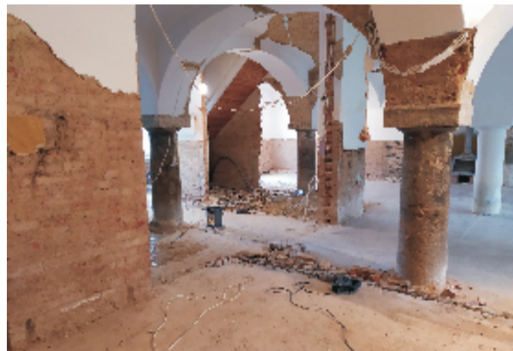
■ Remont świetlicy wiejskiej w Kryształowicach.