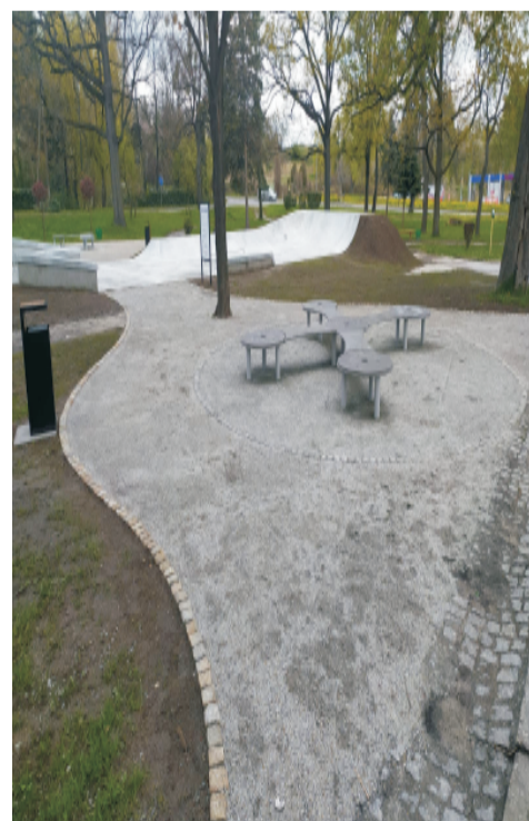
■ Skatepark w Sobótce