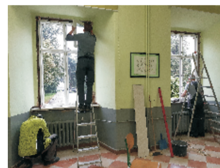
■ I mc dla Szkoły w Rogowie Sobóckim ■ Wymiana okien w ZSP w Świątynkach