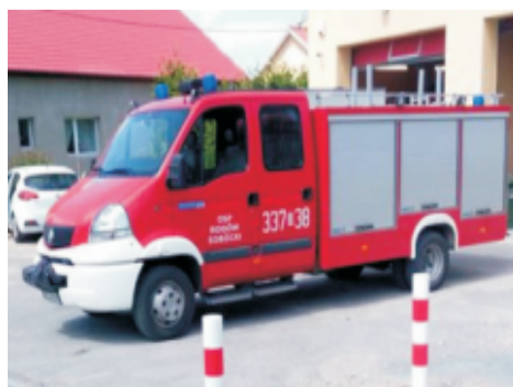
■ Nowy samochód OSP Rogów Sob.