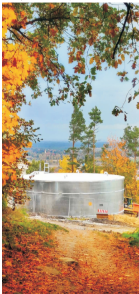
■ Nowy zbiornik na wodę pitną

Ostatnie lata to czas wzmoczonych prac nad poprawą dostępności do nowej i niezawodnej infrastruktury dostarczającej wodę oraz odbierającej ścieki z domów naszych mieszkańców. Dzięki środkom unijnym, Wojewódzkiego oraz Narodowego Funduszu Ochrony Środowiska i Gospodarki Wodnej, programowi Polski Ład i RFIL, możliwa była realizacja inwestycji na łączną kwotę ponad 50 mln zł. Pomimo zaangażowania tak wielu środków, nie zwalniamy tempa i już teraz staramy się o kolejne na realizację zadań z zakresu budowy sieci kanalizacji sanitarnej, modernizacji oczyszczalni ścieków czy stacji uzdatniania wody. Dotychczas udało nam się zrealizować, bądź jesteśmy w trakcie realizacji takich zadań jak: