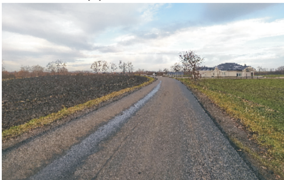
■ Ręków ul.Nasławicka po przebudowie.