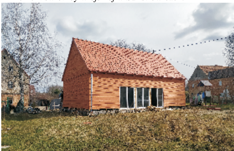
■ Budowa świetlicy wiejskiej Księginicach Małych.