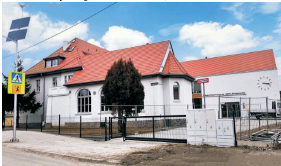
■ ZSP w Rogowie Sobóckim po przebudowie