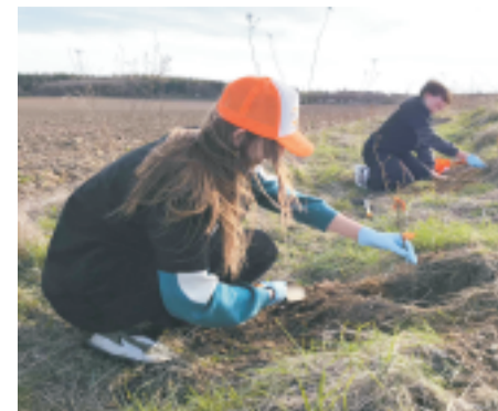
■ Sadzenie drzew

W ramach ambitnego projektu inicjatywy zielonej, gmina Sobótka rozpoczęła szeroko zakrojony program sadzenia drzew w całym mieście. W pierwszym etapie posadzono ponad 300 sztuk grabów, wiązów i lip. W kolejnym etapie uczniowie ze szkoły w Świątnikach posadzili kolejne 300 sztuk drzew tak żeby ograniczyć hałas i kurz z lokalnych kopalni. Sadzenie tych drzew ma nie tylko estetyczne znaczenie, ale przede wszystkim stanowi istotny krok w kierunku poprawy jakości życia mieszkańców. Drzewa nie tylko dodają uroku przestrzeni miejskiej, ale także pełnią szereg niezastąpionych funkcji ekologicznych.