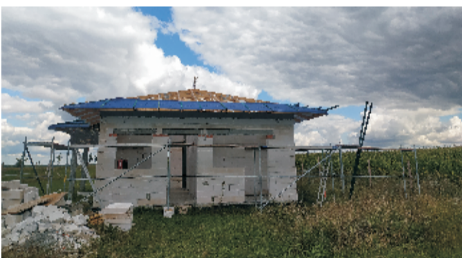
■ Budowa świetlicy wiejskiej w Wojnarowicach.