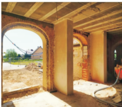
■ Parter szkoły w trakcie przebudowy w ZSP w Rogowie Sobóckim