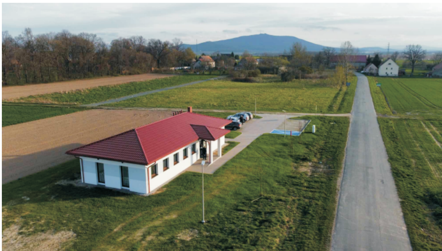
■ Budowa świetlicy wiejskiej w Wojnarowicach.