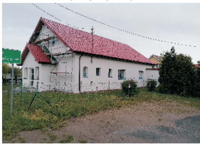
■ Remont świetlicy wiejskiej w Świątnikach.