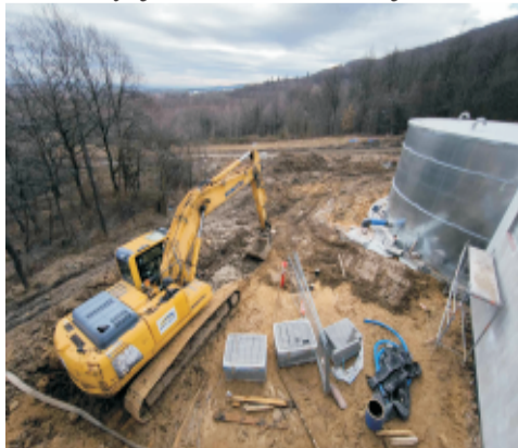
■ Budowa zbiornika