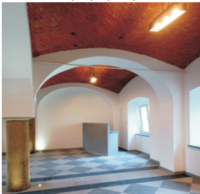
■ Remont świetlicy wiejskiej w Kryształowicach.