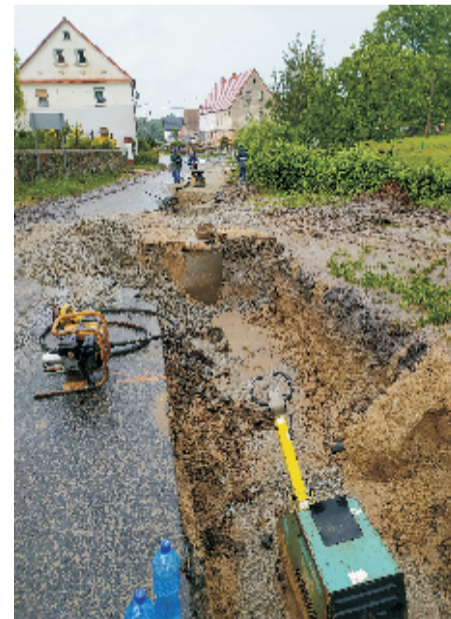
■ Budowa kanalizacji Będkowiec