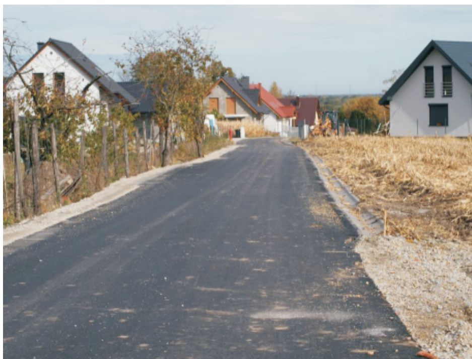
■ Przebudowa ul.Św. Norberta w Strzegomianach na odcinku ponad 1,2 km.