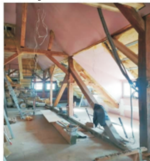
■ Zachowana konstrukcja dachu po renowacji w ZSP w Rogowie Sobóckim