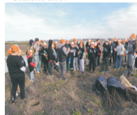
■ Uczniowie szkoły w Świątnikach