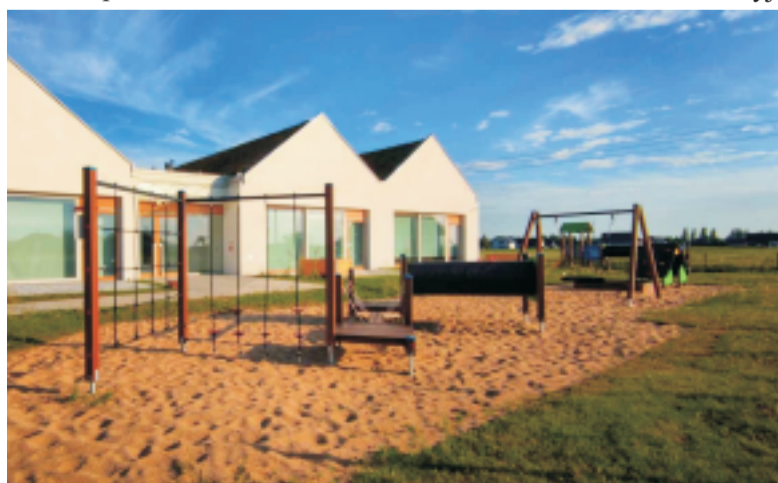
■ Plac zabaw SP Rogów Sobócki