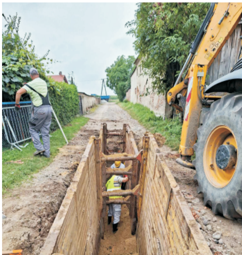
■ Budowa kanalizacji w Michałowicach