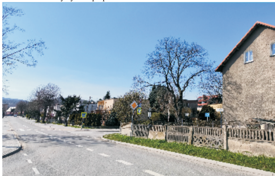
■ Sobótka ul.Dworcowa po przebudowie.