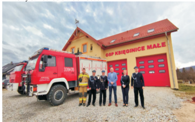
■ Nowa remiza OSP w Księginicach Małych