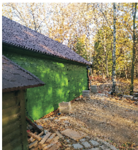
■ Rozbudowa świetlicy wiejskiej w Sulistrowiczkach.