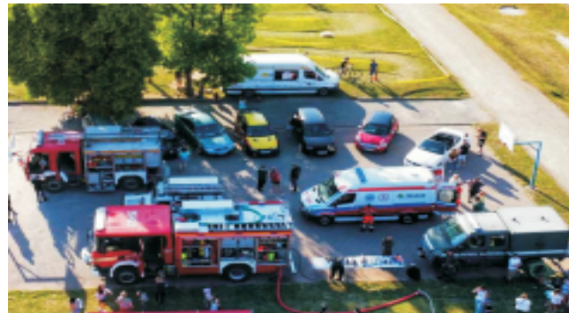
■ Organizacja Dnia Dziecka przez strażaków OSP