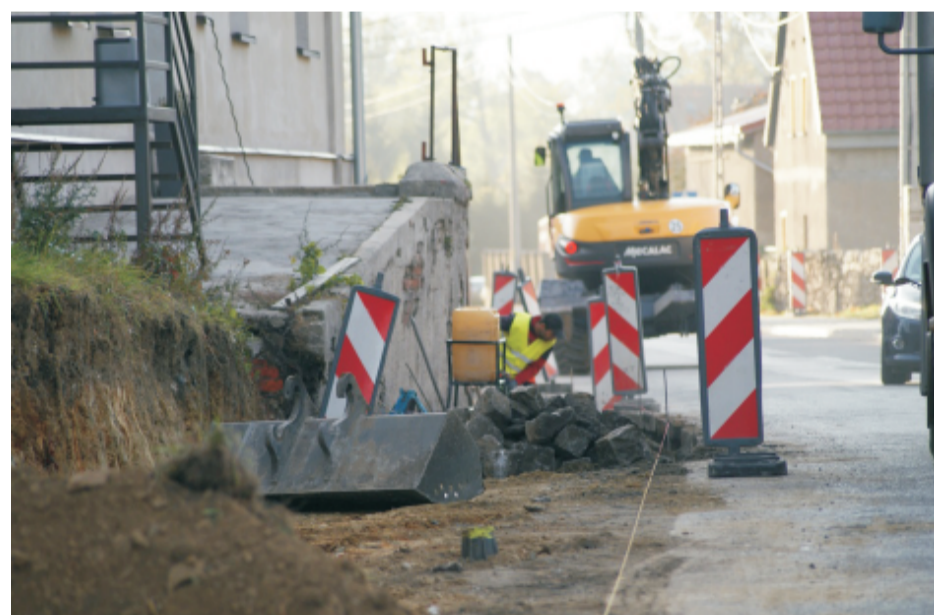
■ Budowa chodnika Garncarsko ul. Nowowiejska.