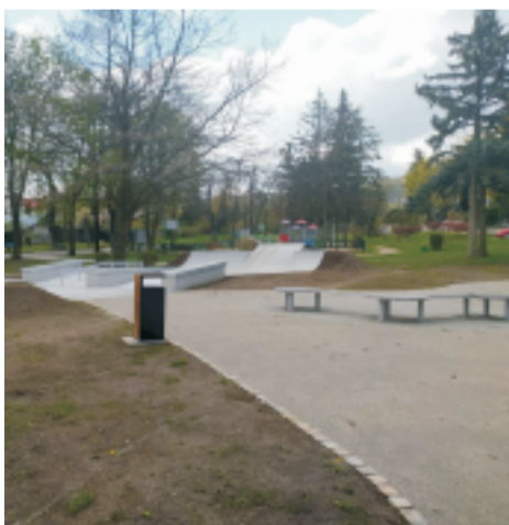
■ Skatepark w Sobótce