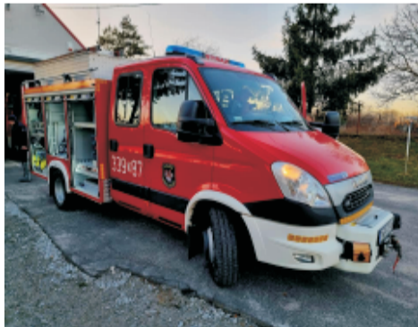
■ Nowy samochód OSP Sobótka Zach.