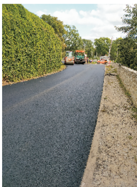
■ Odbudowa dróg