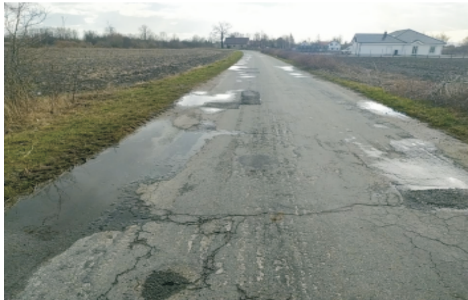
■ Ręków ul.Nasławicka przed przebudową.