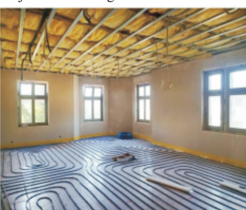
■ Wymiana okien w ZSP w Rogowie Sobóckim