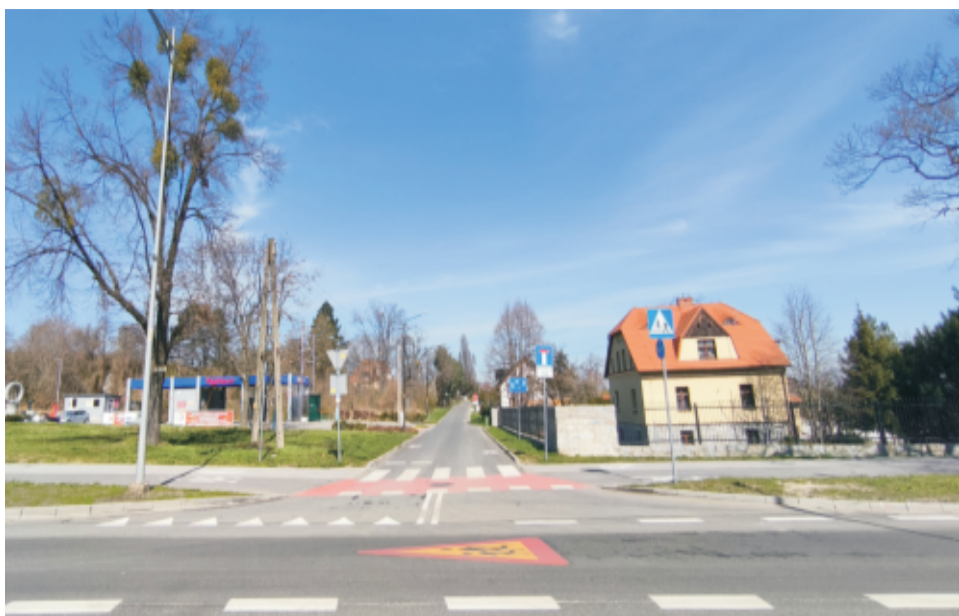
■ Sobótka ul.Turystyczna po przebudowie.