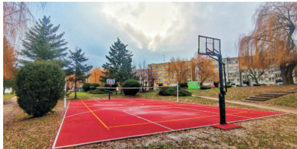
■ Boisko wielofunkcyjne w Sobótce