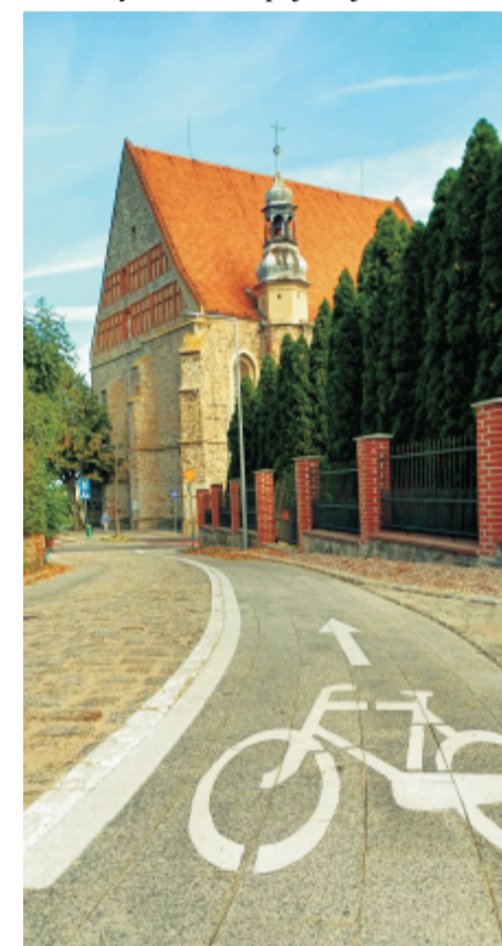
■ Sobótka ul.Cmentarna.

W ramach środków z budżetu gminy i środków zewnętrznych wykonano pierwsze w historii Gminy drogi rowerowe o łącznej długości ponad 5 km wraz z infrastrukturą towarzyszącą, taką jak: chodnik przy ul. Świdnickiej w Sobótce Górcze, 3 parkingi Park and Ride z infrastrukturą smart stadion, wiatami i stacjami naprawy rowerów, toaletę publiczną na pl. ks. Bełcha, ponad 100 energooszczędnych punktów oświetleniowych (w tym 7 doświetlonych przejść dla pieszych) oraz nowe nawierzchnie dróg gminnych (ul. Cmentarna i Chrobrego oraz pl. ks. Bełcha). Łączna wartość całej inwestycji wyniosła 15 mln zł, z czego niemal połowa dofinansowana została z funduszy Unii Europejskiej..