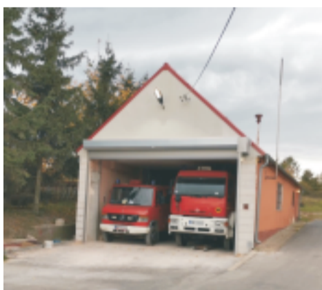
■ Remont remizy OSP Sobótka Zach.