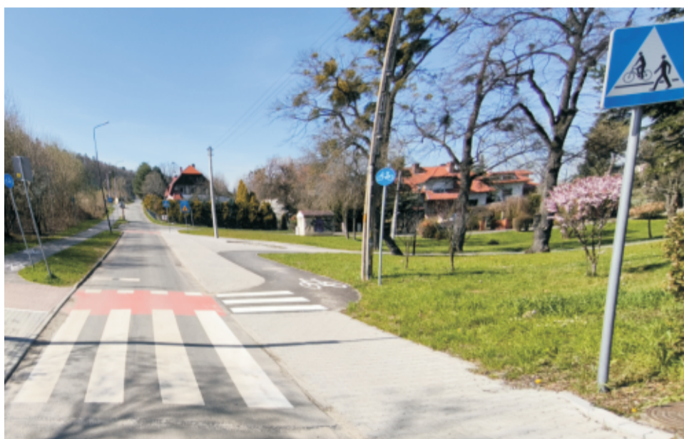
■ Sobótka ul.Słoneczna po przebudowie.