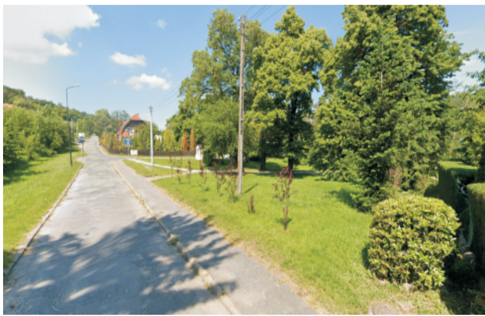
■ Sobótka ul.Słoneczna przed przebudową.