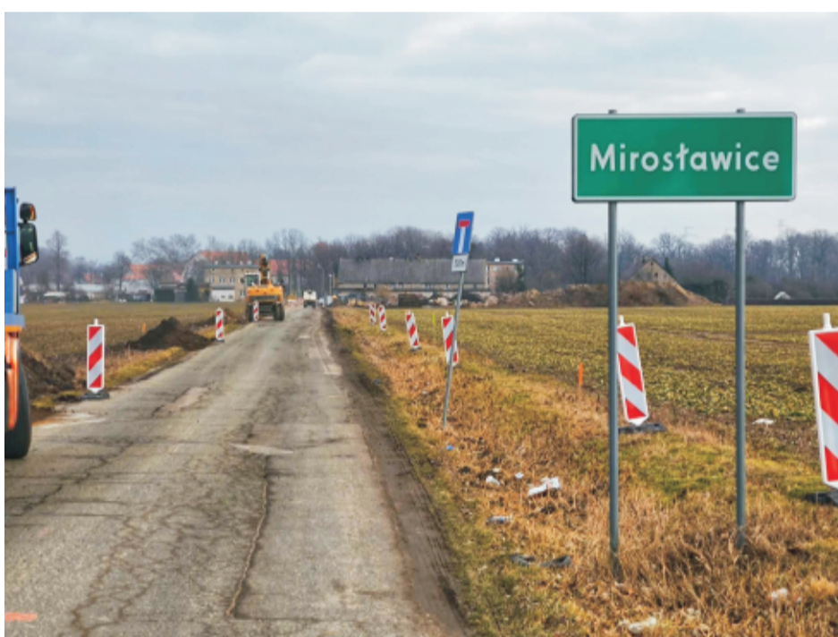
■ Przebudowa drogi w Mirosławciach

W ramach środków z budżetu gminy i środków zewnętrznych wykonano pierwsze w historii Gminy drogi rowerowe o łącznej długości ponad 5 km wraz z infrastrukturą towarzyszącą, taką jak: chodnik przy ul. Świdnickiej w Sobótce Górcze, 3 parkingi Park and Ride z infrastrukturą smart stadion, wiatami i stacjami naprawy rowerów, toaletę publiczną na pl. ks. Bełcha, ponad 100 energooszczędnych punktów oświetleniowych (w tym 7 doświetlonych przejść dla pieszych) oraz nowe nawierzchnie dróg gminnych (ul. Cmentarna i Chrobrego oraz pl. ks. Bełcha). Łączna wartość całej inwestycji wyniosła 15 mln zł, z czego niemal połowa dofinansowana została z funduszy Unii Europejskiej..