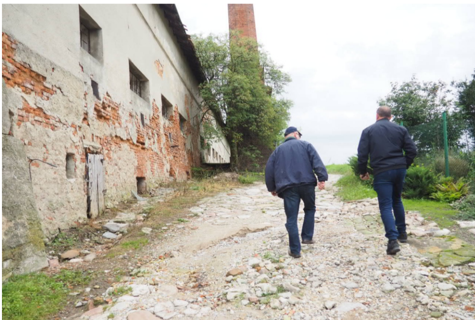
■ Po lewej stronie nieczynna gorzelnia, w późniejszym okresie przekwalifikowana na magazyny zbożowe

Droga do Milina jest najbliższym połączeniem komunikacyjnym z Mietkowem, Kątami Wrocławskimi i autostradą A4. Mieszkańcy zapowiadają kontynuację walki o remont traktu.