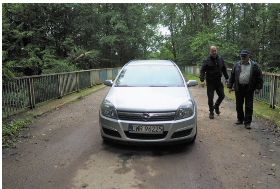
■ Droga do Milina prowadzi przez most. Mieszkańcy od lat walczą o pokrycie nawierzchni asfaltem