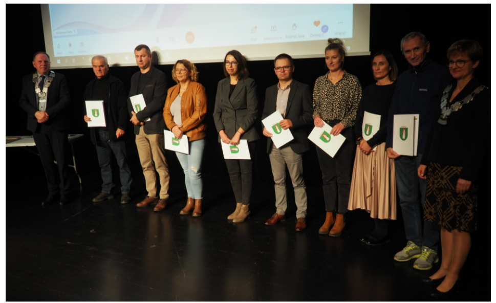
■ Podziękowania i dyplomy dla przedsiębiorców i sponsorów, którzy wsparli organizację Gminnych Dożynek 2022