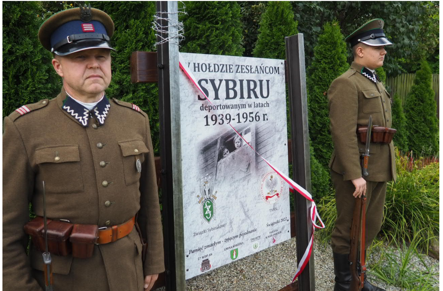
■ Warta honorowa przy tablicy pamiątkowej poświęconej Zesłańcom Sybiru

Spotkania w Świątnikach dedykowane są zesłańcom Sybiru deportowanym w latach 1939 – 1956. W trakcie uroczystości na cmentarzu przy kościele odsłonięto tablicę poświęconą polskim zesłańcom.