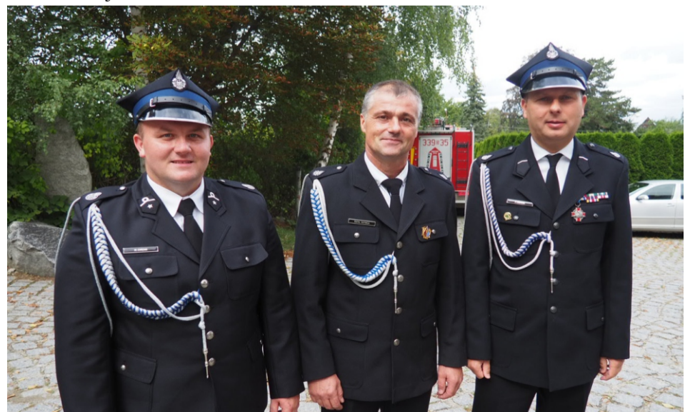
■ Bracia strażacka w galowych mundurach