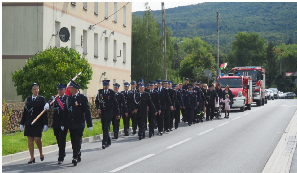
■ Pochód przemaszerował główną ulicą Sobótki Zachodniej