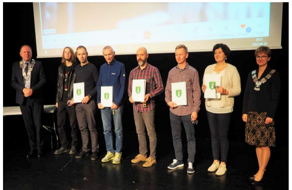
■ Podziękowania i dyplomy za promowanie turystyki w Masywie Ślęży na 27. Górkim Festiwalu w Łądku Zdroju