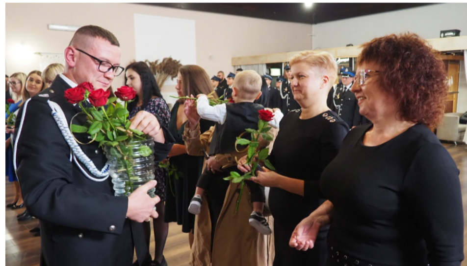
■ ...i ich rodzin