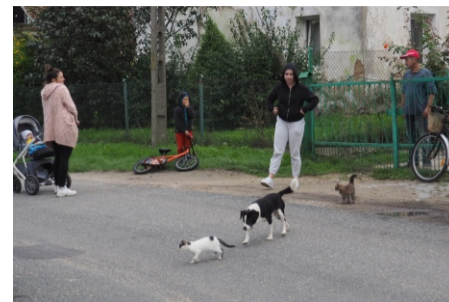
■ Okulice to spokojna miejscowość. Nie ma hałasu, ani ruchu pojazdów – mówią mieszkańcy

W Okulicach znajduje się dawny dwór, który powstał na przełomie XV i XVI wieku. W 1945 roku został częściowo zniszczony, a przez następne lata zdewastowany. Pozostały też ruiny po dawnym młynie ze skrzydłami (typu holenderskiego). Przy ulicy Leśnej znajduje się młyn zbożowy, który został wybudowany przed wojną.