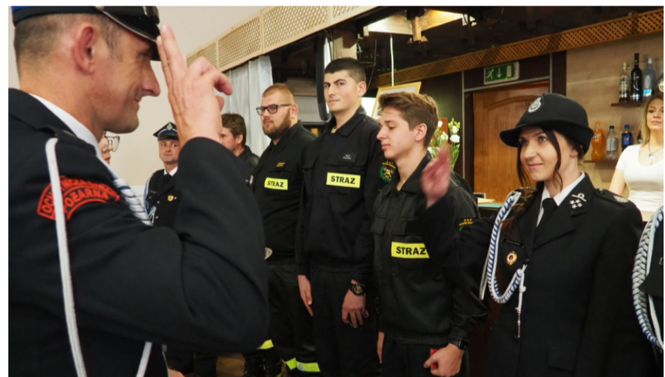
■ Gratulacje dla strażaków...