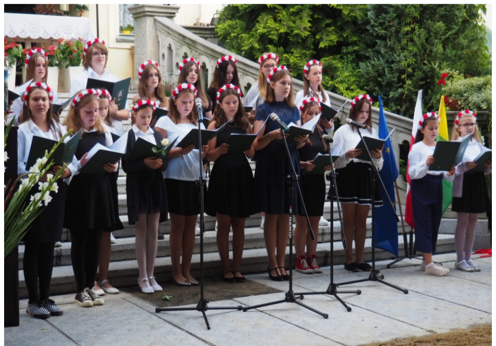
■ Wydarzenie uświetnił występ uczniów z ZSP w Świątnikach