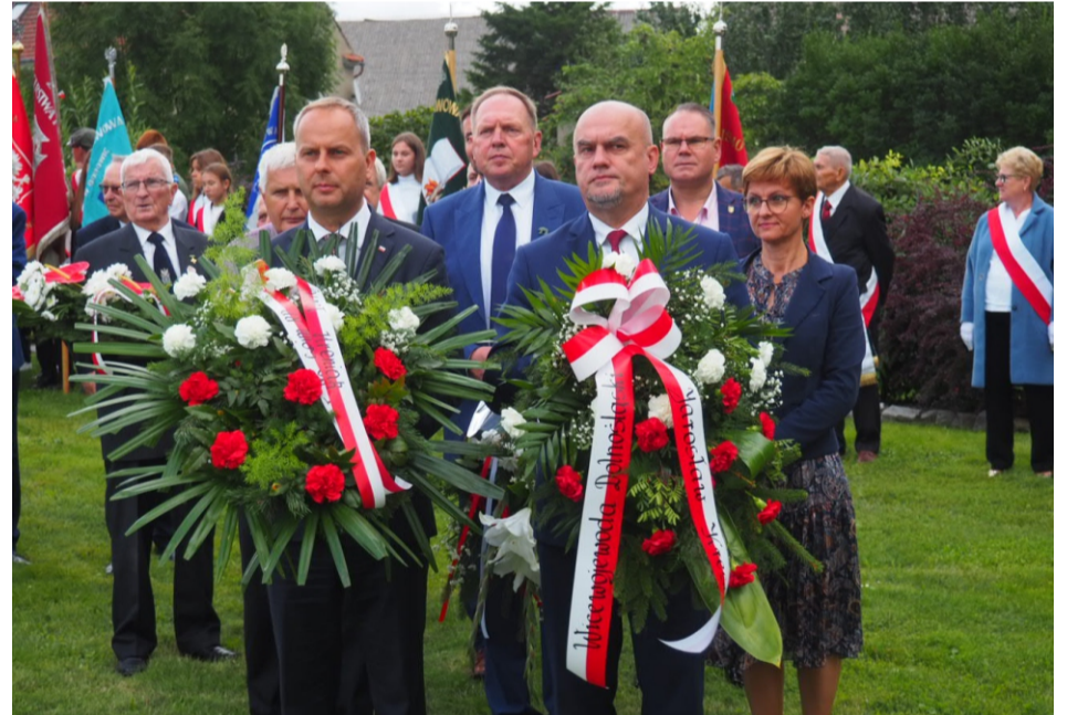
■ Uroczyste złożenie wieńców pod tablicą pamiątkową