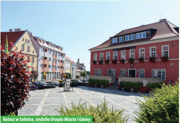
Rynek w Sobótce, siedziba Urzędu Miasta i Gminy

W Sobótce zachował się pierwotny układ z centralnym wydłużonym rynkiem, co świadczy o początkach miasta jako osady targowej. W rynku znajdują się ważne obiekty – kościół pw. św. Jakuba, Muzeum Ślązańskie oraz Urząd Miasta i Gminy.