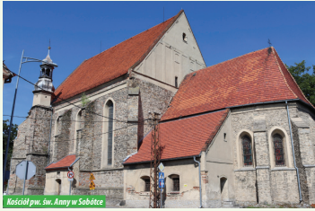
Kościół pw. św. Anny w Sobótce

Powstał w XIV w. jako kaplica cmentarna, rozbudowany w kolejnych wiekach. Całość została przebudowana w XVIII w. w stylu barokowym. Kościół jest murowany z kamienia i cegły. Wyposażenie kościoła jest głównie barokowe, ale znajdują się tu też cztery późnogotyckie drewniane rzeźby. Obok kościoła ustawione są kamienne rzeźby – romański lew i kultowy „Grzyb”.