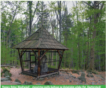
Panna z Rybą i Niedźwiedź – starożytna rzeźba kultowa na śląskim szlaku