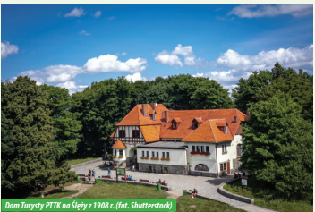
Dom turysty PTTK na Ślęży z 1908 r.

Dominuje w krajobrazie miasta. Pierwotnie wzniesiony w XIII w. w stylu romańskim. W wyniku przebudowy zyskał formę gotycką, a po pożarze w 1730 r. – barokową. Uległ znacznym zniszczeniom w czasie II wojny światowej. W jednej z przypór umieszczona jest rzeźba romańskiego lwa z XII w. Kościół posiada wystrój głównie barokowy i otoczony jest kamiennym murem.