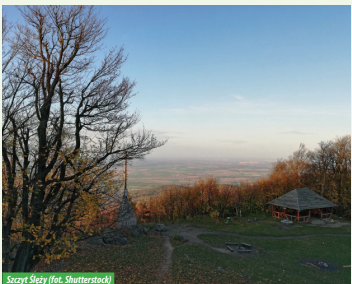
Szczyt Ślęży

Najwyższy szczyt masywu (718 m n.p.m.) zbudowanego z gabra, granitu, amfibolitu i serpentynitu. Urozmaicona rzeźba terenu oraz bogactwo roślin i zwierząt tworzą niezwykle atrakcyjne środowisko przyrodnicze i krajobrazowe. W obrębie góry i u jej podnóża znajdują się rzeźby kultowe wykonane z rodzimego kamienia. Góra Ślęży po raz pierwszy wymieniona została w XI w. przez kronikarza Thietmara jako kultowy ośrodek plemienia Ślęzan.