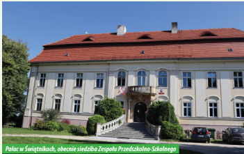
Pałac w Świątyniach, obecnie siedziba Zespołu Przedziałka Szkolnego

Z pierwotnego parku o powierzchni 9 ha założonego w XVII w. i przekształconego w XIX w., obecnie pozostały tylko 2 ha.