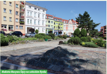
Makieta Masywu Ślęzy na sobótczym Ryńku