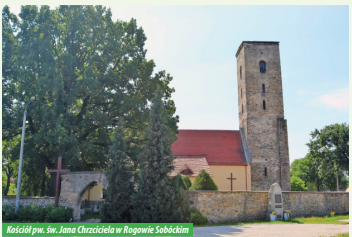
Kościół pw. św. Jana Chrzciciela w Rogowie Sobótczym