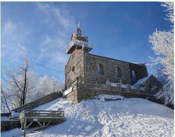
Kościół pw. Najświętszej Marii Panny na Ślęży

KOŚCIÓŁ PW. NAJŚWIĘTSZEJ MARI PANNY NA ŚLĘŻY Na ruinach średniowiecznego zamku na przełomie XVII i XVIII w. wzniesiony został barokowy kościół. Do budowy użyto miejscowego surowca skalnego – gabra i granitu. Budynek sponął od uderzenia pioruna w 1834 r. Odbudowana w latach 1851–52 świątynia istnieje do dzisiaj. Na szczytce znajduje się wieżyczka z galerią.