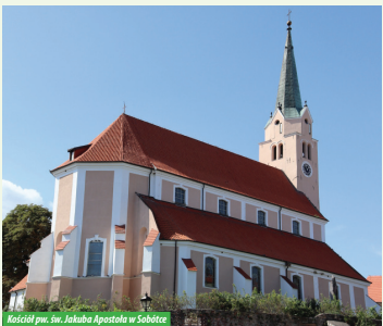
Kościół pw. św. Jakuba Apostoła w Sobótce