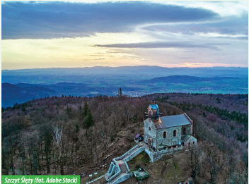
Szczyt Ślęży