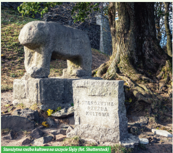
Stary rzeźba kultowa na szczytce Ślęży

Na terenie Masywu Ślęzy znajduje się kilka rzeźb kultowych, z których najbardziej znana jest rzeźba niedźwiedzia na szczytce Ślęży. Na uwagę zasługują też „Panna z rybą” i „Mnich” położone przy szlakach turystycznych. Rzeźby te nie znajdują się w swoich pierwotnych lokalizacjach, stanowią ważny element historii pogańskich wierzeń religijnych plemion tu zamieszkujących.