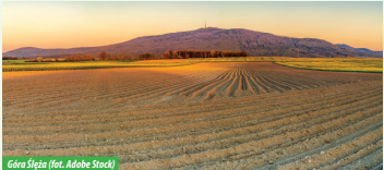
Góra Ślęży