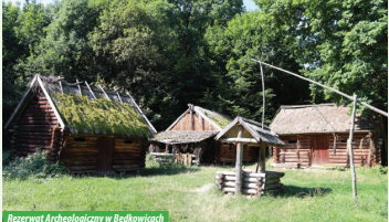
Rezerwat Archeologiczny w Będkowicach