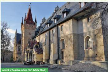
Zamek w Sobótce-Górcy