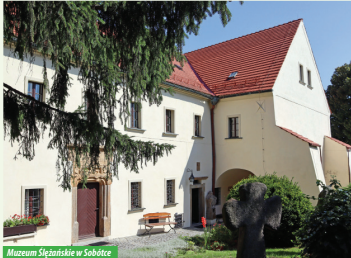
Muzeum Ślązańskie w Sobótce

Muzeum powstało w 1962 roku. Mieści się we wczesnonorenesansowym budynku dawnego szpitala miejskiego z XVI w. Wokół rozciąga się łąki, w którym zgromadzone są zabytkowe rzeźby i detale architektoniczne z regionu. Na piętrze, znajduje się unikatowa wystawa stała – „Dawne wizerzenia”, poświęcona kulturze ludzkiej oraz ekspozycja przyrodnicza i historyczna.