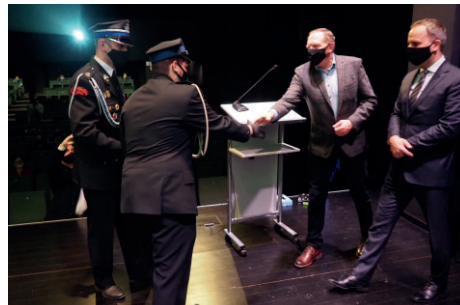
■ Przedstawiciele jednostek odbierają listy gratulacyjne