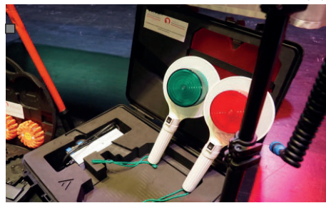
■ Specjalistyczny sprzęt do ratowania życia i zdrowia ludzi dla OSP

Jednostkom OSP z gminy Sobótka wręczono listy gratulacyjne. Sprzęt zakupiono w ramach realizacji zadania „Poprawa bezpieczeństwa mieszkańców Gminy Sobótka poprzez wyposażenie jednostek OSP w specjalistyczny sprzęt do ratowania życia i zdrowia, współfinansowanego ze środków Funduszu Sprawiedliwości, którego dysponentem jest Ministerstwo Sprawiedliwości i Gmina Sobótka”. (b)