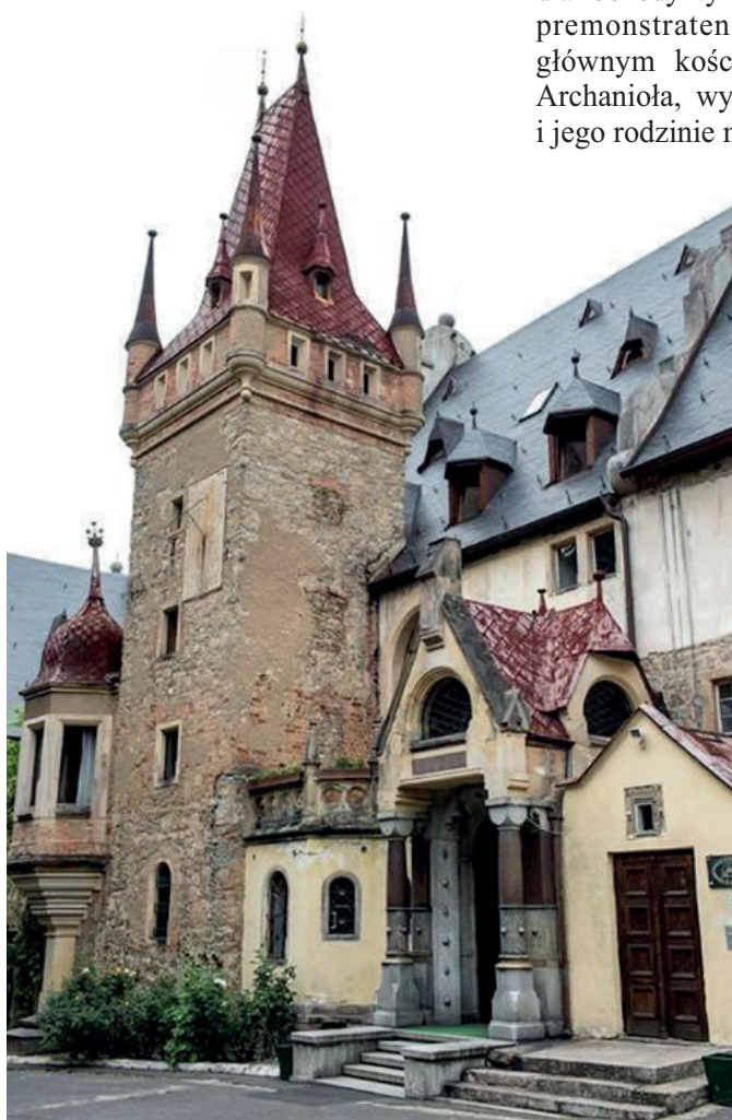
■ Zamek w Sobótce Górcie

Piotr powrócił z Węgier po wygnaniu Władysława II, zwanego odtąd Wygnańcem. Zwrócono mu skonfiskowane majątki i przywrócono dobre imię. Sterany nieszczęściami zmarł komes Piotr Włostowic w roku 1153 i został pochowany w opactwie na Ołbinie wrocławskim.