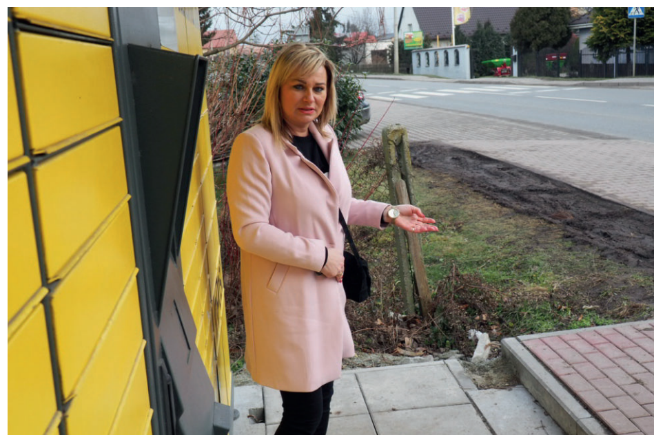
■ Jednym z problemów jest paczkomat, zlokalizowany przy drodze głównej. Parkujące przy nim auta rozjeżdżają chodnik i pobocze.