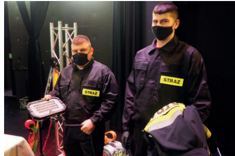
■ Strażacy otrzymali specjalistyczny sprzęt ratowniczy