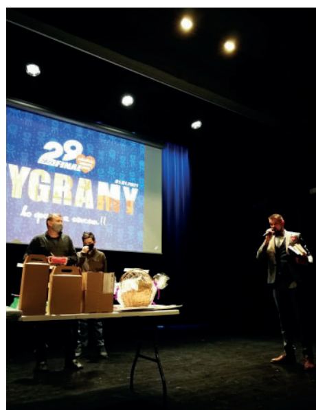
■ Licytacja w RCKS