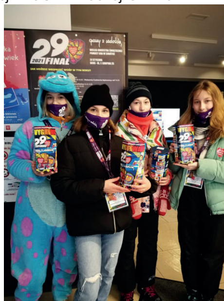
■ Dzielne i niestrudzone wolontariuszki